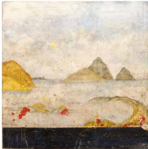
Pierre-Marie Brisson, "Entre ciel et mer", 2008, 150 X 150 cm.