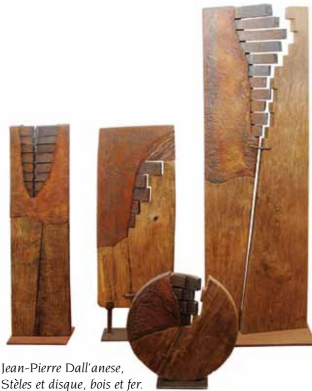
Jean-Pierre Dall'anese, "Stèles et disque", bois et fer.