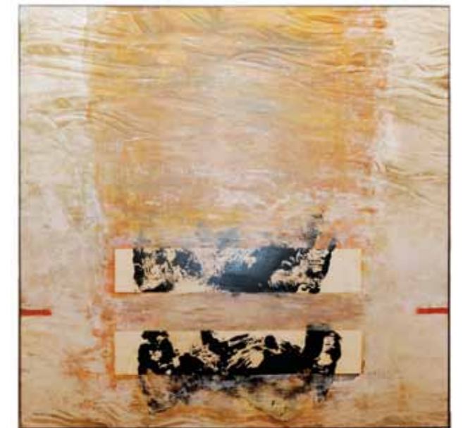
Paul Brunner, 2010, 110 x 120 cm.